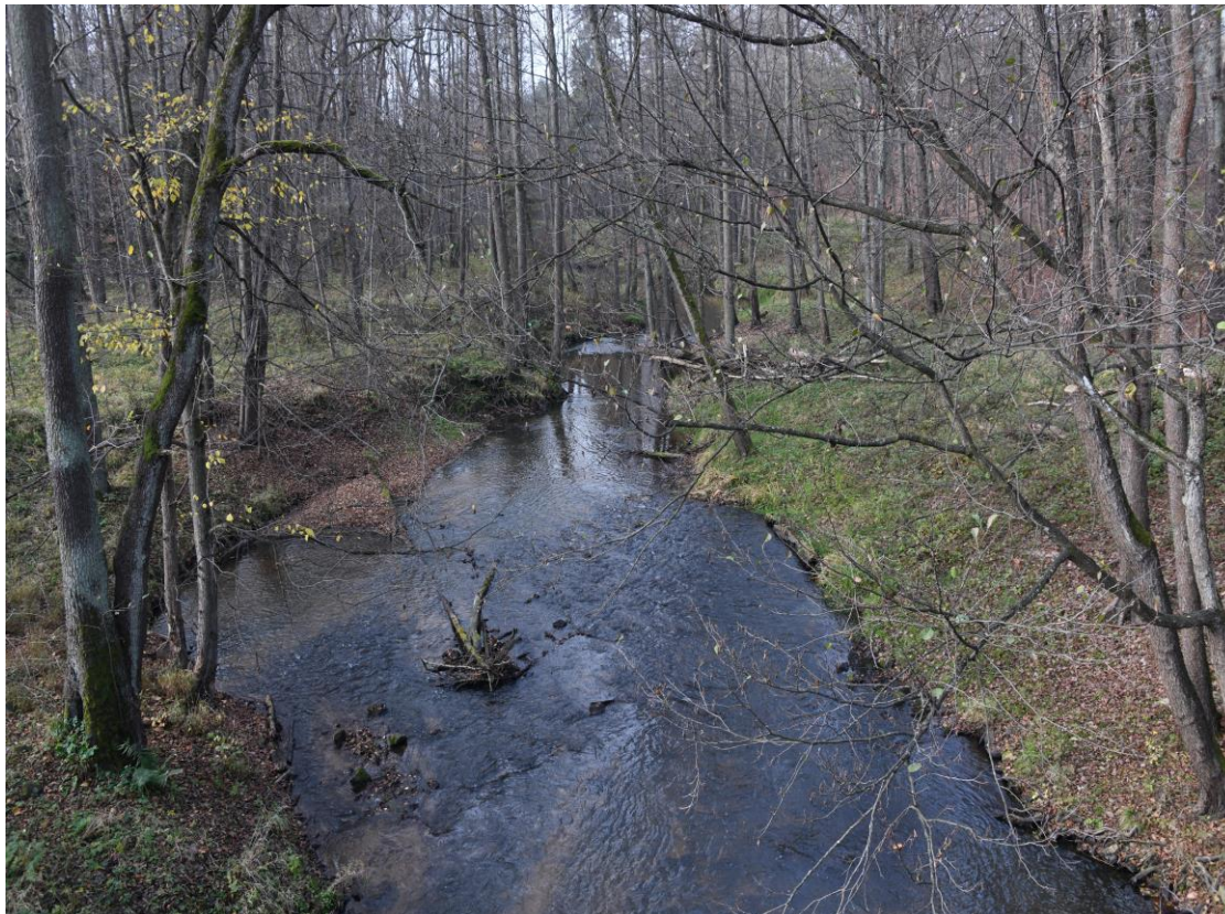
Zarośnięte obniżenie terenu w dawnym starorzeczu Małej Panwi; widok w kierunku budynku gajówki