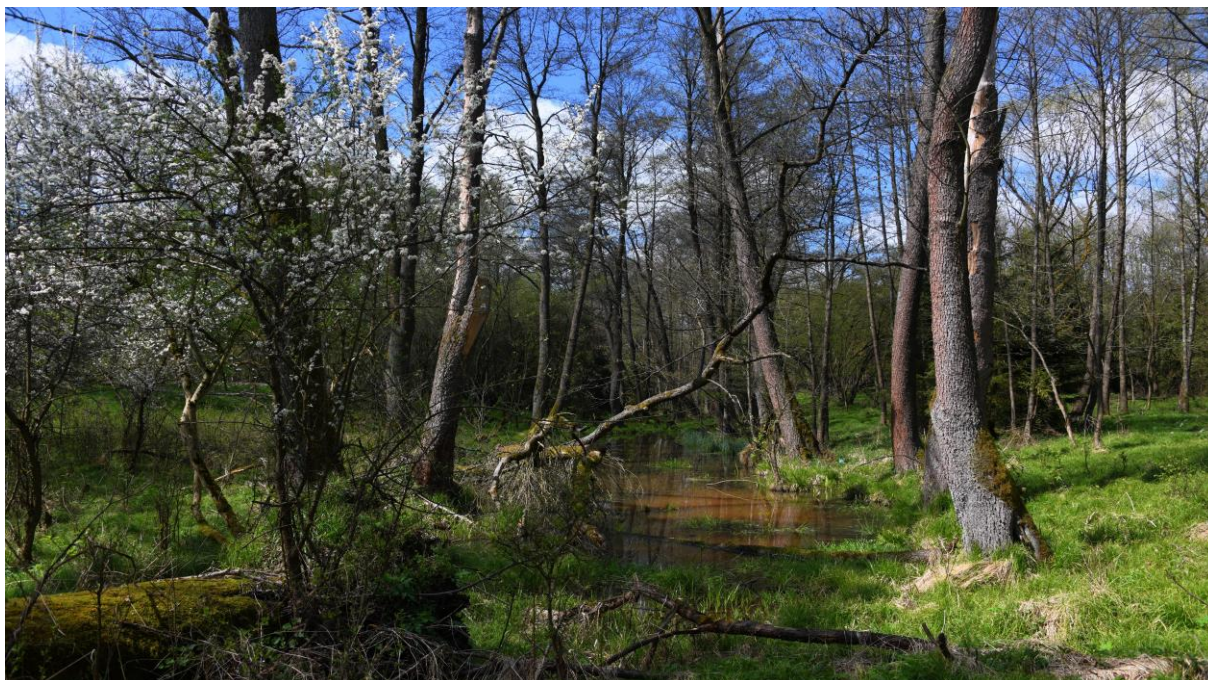
Rozlewiska Małej Panwi