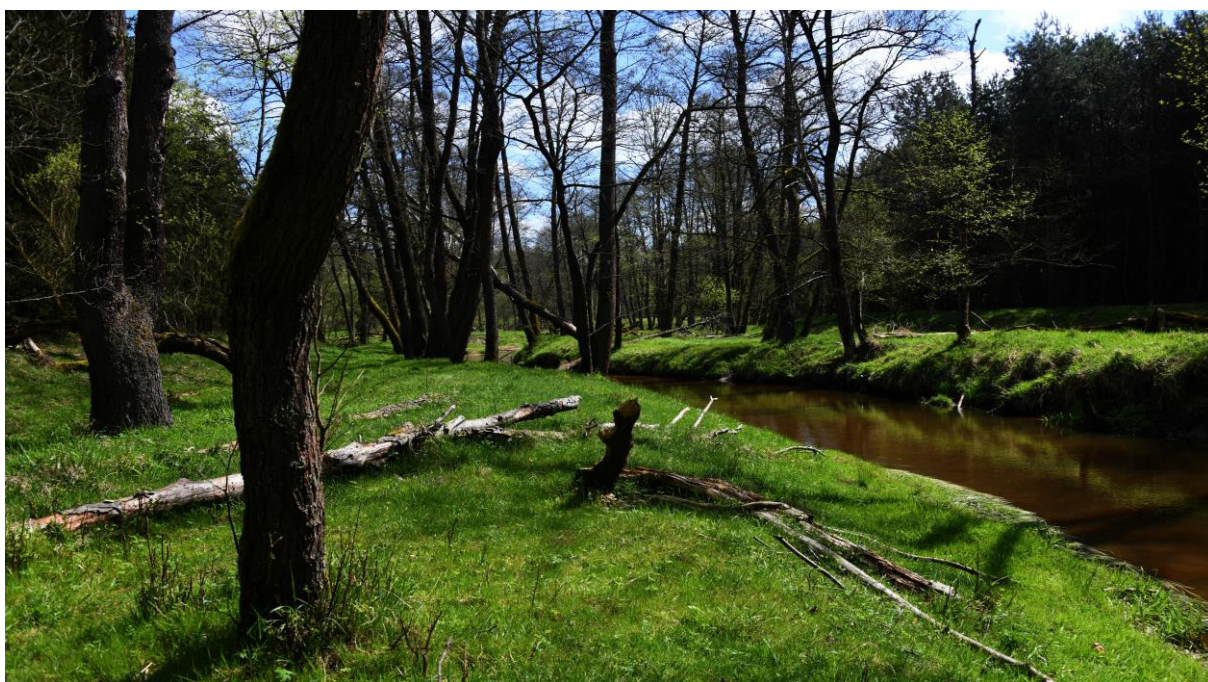
Naturalne koryto Małej Panwi z dobrze widoczną terasą nadzalewową